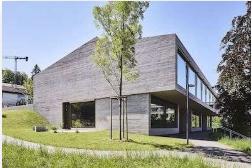
Talholz; 4103 Bottmingen, Schulstrasse 5c

Zum Burggarten gehört der kleine Aussenstandort Provisorium, welcher an drei Tagen für Mittagstisch geöffnet ist.