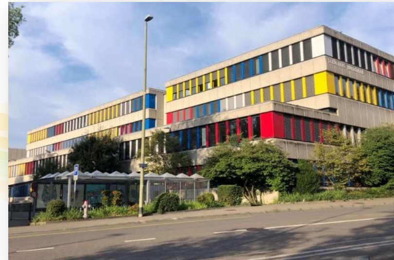
Burggarten; 4103 Bottmingen, Burggartenstrasse 1